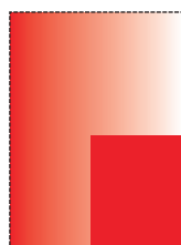
1/4 strony 123,8x 180mm