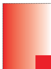
4 moduły 81,2x89mm